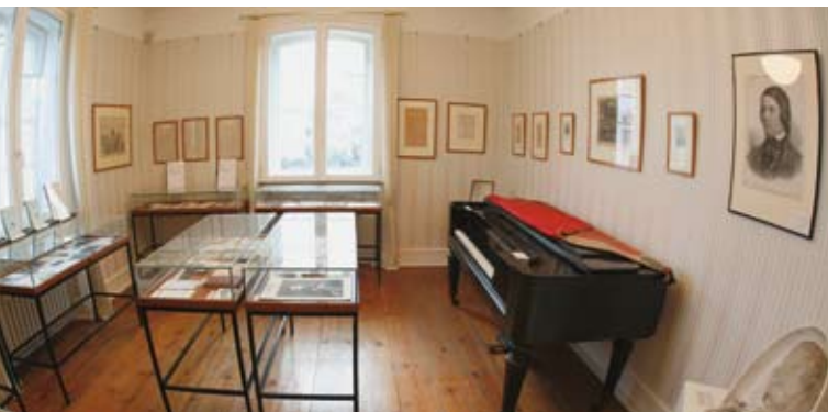
Museum, Krankenzimmer Schumanns

spiele, Musikmärchen), für Dich ist also bestimmt auch etwas dabei.