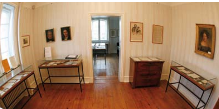
Museum, Vorraum zum Krankenzimmer